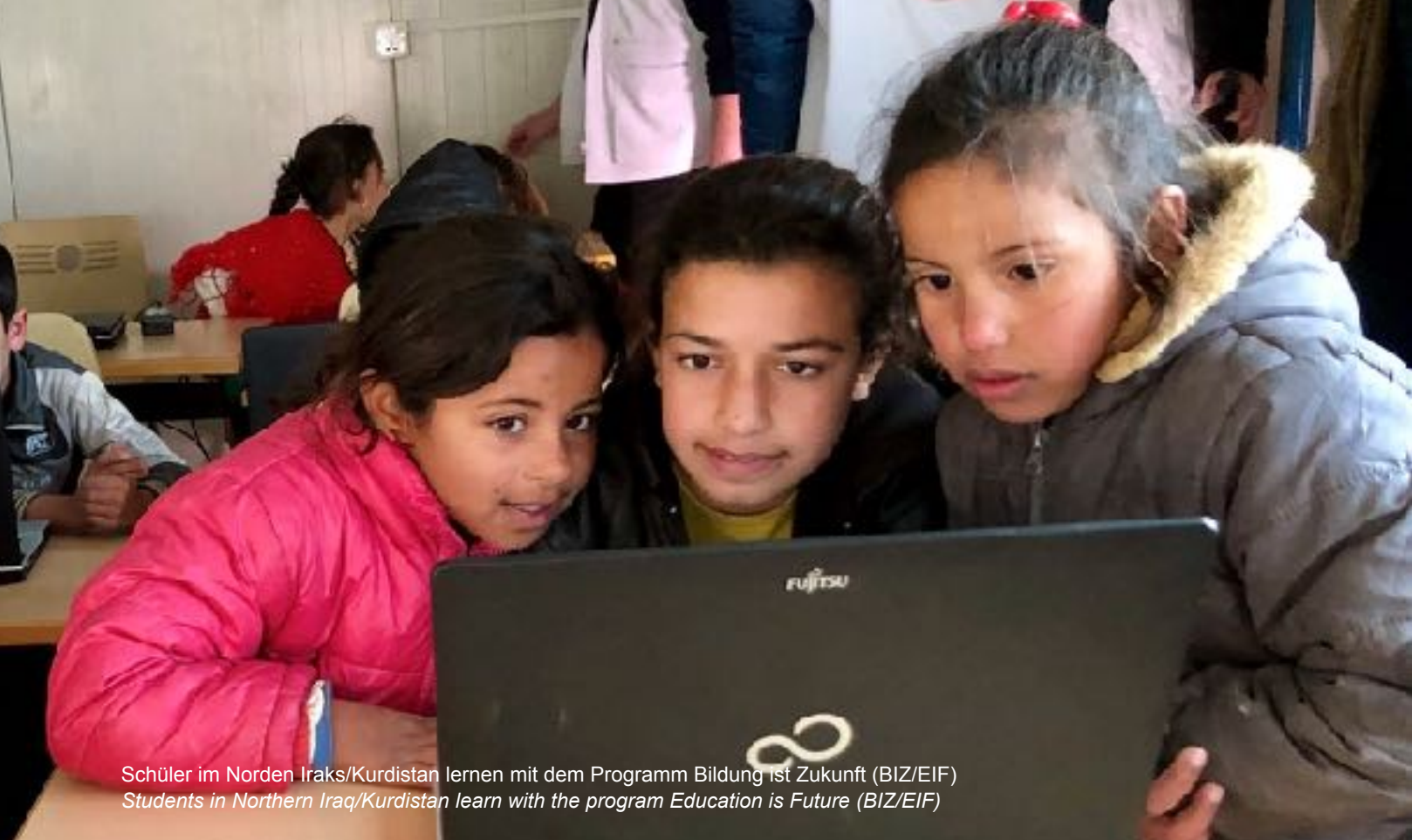
Schüler im Norden Iraks/Kurdistan lernen mit dem Programm Bildung ist Zukunft (BIZ/EIF) Students in Northern Iraq/Kurdistan learn with the program Education is Future (BIZ/EIF)