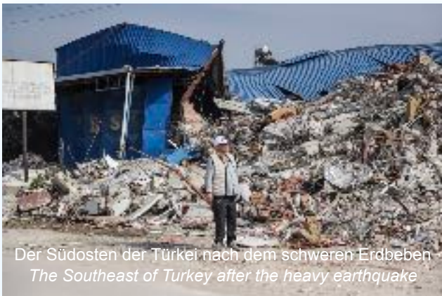
Der Südosten der Türkei nach dem schweren Erdbeben The Southeast of Turkey after the heavy earthquake

Erdbeben: 1.000 Schlafsäcke und 100 Zelte erreichen die Hatay-Region