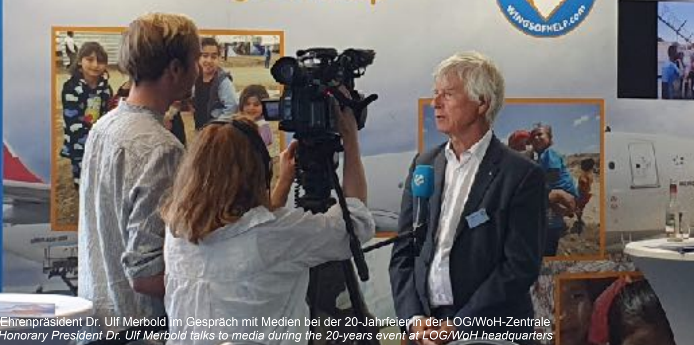
Ehrenpräsident Dr. Ulf Merbold im Gespräch mit Medien bei der 20-Jahrfeier in der LOG/WoH-Zentrale Honorary President Dr. Ulf Merbold talks to media during the 20-years event at LOG/WoH headquarters