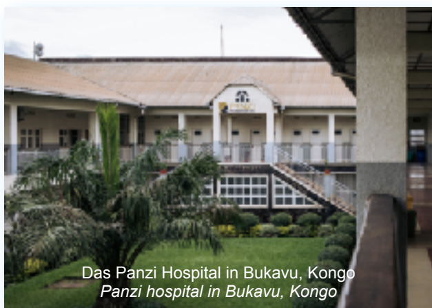
Das Panzi Hospital in Bukavu, Kongo Panzi hospital in Bukavu, Kongo

Auf internationale Rettung können Flüchtlinge in der von Krieg geschundenen Demokratischen Republik Kongo bauen: In dem 100-Millionen-Einwohner-Staat im Zentrum Afrikas kooperiert Aviation Sans Frontières (ASF), dem LOG/WoH als deutsche Partner angehört, mit der Stiftung des Friedensnobelpreisträgers Dr. Denis Mukwege. Er betreibt in der Provinzhauptstadt der Region Kivu, in Bukavu, das Panzi Hospital. Diese Einrichtung sorgt sich insbesondere um Frauen, die im Krieg des Landes mit über fünf Millionen Binnenflüchtlingen Schutz vor schlimmer Verfolgung und Brutalität suchen. Gerade Frauen und Kinder müssen im Kongo mit seinen über 200 rivalisierenden Ethnien vermehrt als lebende Schutzschilde unter großer Gewalt herhalten. Das Panzi Hospital hat seit seiner Eröffnung vor gut 20 Jahren mehr als 90.000 Frauen behandelt – und 3.500 Babys zur Welt gebracht.