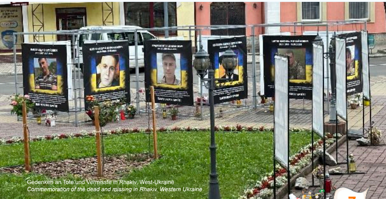
Gedenken an Tote und Vermisste in Rhakiv, West-Ukraine Commemoration of the dead and missing in Rhakiv, Western Ukraine