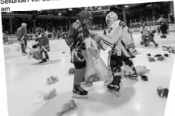
Teddy-Bear-Toss-Tag Eisbären Regensburg mit 4:3

Eishockey: EHC Freiburg erzielt 24 Sekunden vor Schluss den Siegtreffer - Freiburger Wölfe besiegen am Teddy-Bear-Toss-Tag Eisbären Regensburg mit 4:3 - Eishockey: EHC Freiburg erzielt 2 Sekunden vor Schluss den Siegtreffer - Freiburger Wölfe besiegt am