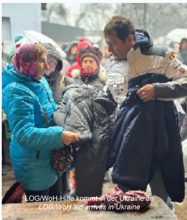
LOG/WoH-Hilfe kommt in der Ukraine an LOG/WoH aid arrives in Ukraine

ity. At the same time, many private individuals are committed to helping the people in the partially destroyed country. They all see LOG/WoH as a trustworthy contact point and relay station for humanitarian operations. We are grateful to all our supporters and will continue to follow this obligation in the future.”